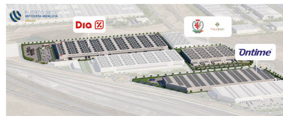
▲ Desarrollo de los primeros activos logísticos: las plataformas de Ontime y Dia

Estas implantaciones consolidan el proyecto y posicionan el Puerto Seco de Antequera como un hub capaz de atraer a actores de primer nivel, favoreciendo la llegada de nuevos operadores.